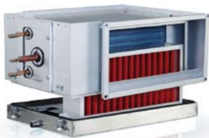
PGDX z zamontowanym separatorzem wody, DE

Chłodnica kanałowa PGDX przeznaczona jest do montażu w poziomym kanale o dowolnym kierunku przepływu powietrza (węzownice rewersyjna).